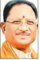
सोम विष्णुदेव साय

लंबे समय बाद प्रदेश की सरकार अपने मंत्री मंडल सहित बुधवार को जिले में बैठने जा रही है। जहाँ कैबिनेट मंत्रियों के अलावा 12 जिलों के कलेक्टर और विधायक व विभागीय सचिव स्तर के अधिकारी सहित अमला