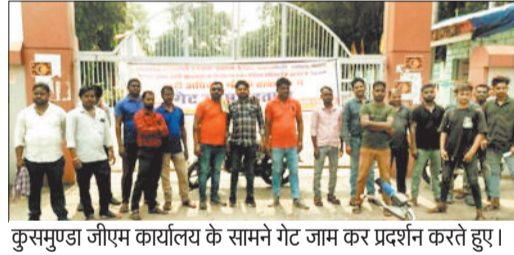
कुसमुण्डा जीएम कार्यालय के सामने गेट जाम कर प्रदर्शन करते हुए।