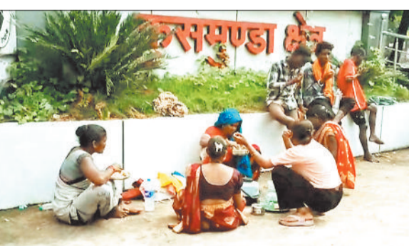
जीएम कार्यालय के मुख्यद्वार पर धरना देती भूविस्थापित महिला।

एसईसीएल कुसमुण्डा खदान से प्रभावित भूविस्थापित महिलाओं ने मंगलवार को दूसरे दिन भी कुसमुण्डा जीएम कार्यालय के मुख्यद्वार पर धरना प्रदर्शन किया। भूविस्थापित महिलाएं दूसरे दिन भी खाट व बर्तन लेकर मुख्य द्वार पर पहुंची और बारिश के बीच धरना प्रदर्शन शुरू कर दिया। इस दौरान भूविस्थापित महिलाओं ने गेट के सामने ही भोजन बनाकर खाया। भूविस्थापित महिलाओं का कहना है कि जब तक हमारी मांगे पूरी नहीं होंगी धरना प्रदर्शन जारी रहेगा।