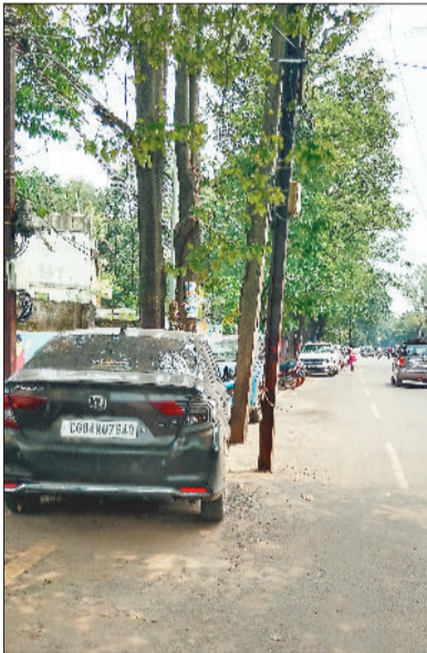
वेयर हाउस रोड पर लगे खंबे।

शहर के कई सड़कों पर बेतरतीबी से लगाए गए खंबे लोगों की जान ले सकते हैं। सड़कें चौड़ी होने के बाद बिजली के बड़े-बड़े खंबे सीधे सड़क के बीचों बीच दिखाई देती हैं, जिससे जान और माल दोनों को नुकसान पहुंच सकता है, लेकिन बिजली विभाग के अधिकारी इसे किनारे लगाने के लिए योजना का इंतजार कर रहे हैं। दरअसल विभाग के पास फंड की कमी है, ऐसे में इन खंबों को हटाने के लिए मदद की जरूरत है, विभाग की हालत पहले से ही पतली है, जिसके चलते खंबे नहीं हट रहे हैं। शहर में अमेरी से