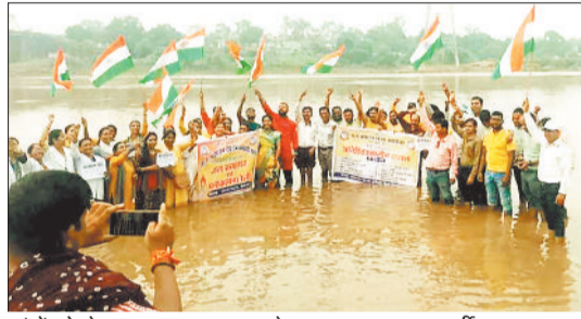
मांगों को लेकर जल सत्याग्रह करते एनएचएम स्वास्थ्य कर्मी।