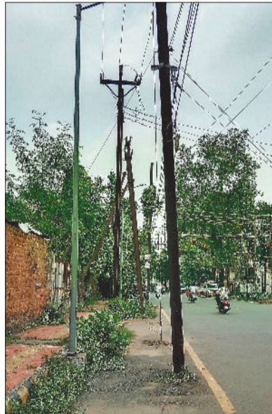
नेहरू नगर जाने वाली सड़क पर लगे खंबे।

नेहरू नगर मार्ग, वेयर हाउस रोड, करबला से बसरटैंड रोड, इंदू चौक, मगरपारा, मंगला, अग्रसेन चौक, सरकंडा मुखा मार्ग जैसे जगहों पर